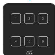
DALI-2 牆面開關 E type