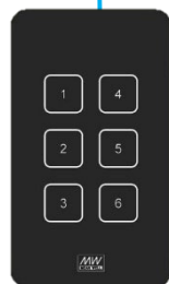
DALI-2 牆面開關 U type