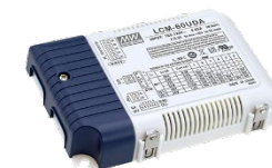
LCM 系列 DALI-2 DT8 C.C mode Tunable White