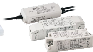
XLN/XLC系列 LCM 系列 DALI-2 DT6 C.C Mode