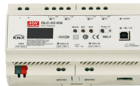
KNX 轉 DALI 閘道